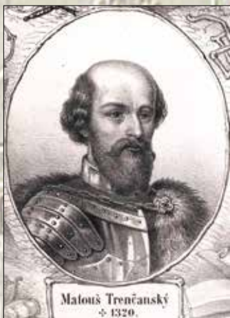
Portrét Matúša Čáka