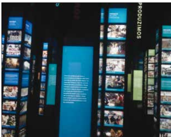
Obrázok 2: Spôsob života v súčasnosti

ma hranice. Ostatné vrstvy majú tendenciu napodobňovať životný štýl elít. Aké sú šance ľudí prežiť dôsledky sľubovaného blahobytu? Stav sveta sa neustále zhoršuje pôsobením splodín našej prosperity a situácia dosiahla rozmerov, keď ďalšie splodiny blahobytu už ohrozujú jednoduché prežitie. Nedostatok zdrojov však nie je v ekologickej situácii hlavným limitujúcim faktorom. Tým je obmedzená schopnosť našej planéty absorbovať splodiny toku materiálu ekonomickým systémom a sprevádzaný rast splodín. Trh nie je schopný korigovať množstvo výroby v závislosti na schopnosti prírody absorbovať znečistenia výrobou emitované. Trh však spoľahlivo dokáže zaistiť uspokojenie ponuky toho, kto viac zaplatí. 12)