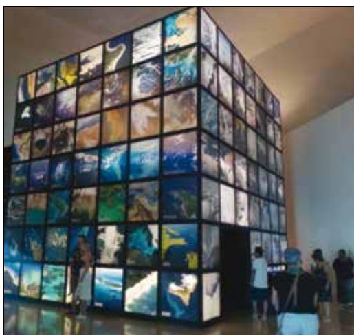
Obrázok 1: Život na planéte

Environmentalistika je pojem, ktorý pochádza zo sedemdesiatych rokov 20. storočia. Netýka sa len aktuálnosti krízy v prírodnom prostredí, ale aj krízy v spoločnosti, a teda aj kultúry. Jej lingvistický pôvod je vo francúzskom slove environnement či v anglickom environment , čo v oboch jazykoch znamená okolie, prostredie. Okrem iného, je širším termínom ako ekológia a zameriava sa najmä na analyzovanie vzťahu človeka a prírody. V súčasnosti sa veľa hovorí o globálnej environmentálnej kríze. Tento jav existuje vďaka kultúre, čo znamená, že ju spôsobil človek. V rámci svojej evolúcie sa človek zameril na produkovanie nadproduktie, ktorá predstavuje neustále nové technické výtvarky a technológie, ich zdokonaľovanie. To so sebou prináša väčšiu spotrebu prírodných zdrojov, ako aj energie. Pokiaľ človek nepoznal auto, televíziu, počítač, mobilný telefón atď., nepotreboval ich k svojej existencii. 1) V súčasnosti sú jeho neoddeliteľnou súčasťou. Potrebuje neustále vyrábať lepšie a kvalitnejšie, a následne tým aj viac konzumovať.