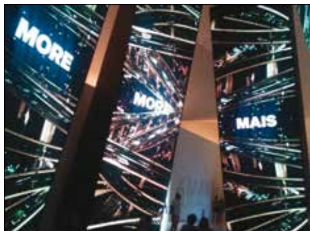
Obrázok 5: Viac neznamená lepšie a kvalitnejšie

chutnejšie. Aj keď sú plastové fľaše ľahšie, nie všetky sa recyklujú. Ich obsah vyjde lacnejšie a samotný obal sa môže vyhodiť. Stačilo by nariadenie, ktoré by zakazovalo ich výrobu. Tento krok, ale nie je v záujme tých, ktorí z výroby PET fliaš finančne profitujú. 22)