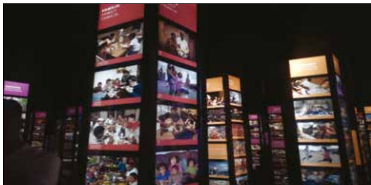
Obrázok 4: Život na vidieku

logický škodlivé. Európska únia má vypracovanú celú škálu opatrení na nakladanie s odpadmi, ich recykláciu, či opätovné použitie vo výrobe alebo obehu. Najhoršie na tom sú veľké mestá v rozvojových krajinách, kde milióny obyvateľov nepoznajú zber odpadov, vyhadzujú ich voľne na ulice, nepoznajú kanalizáciu.