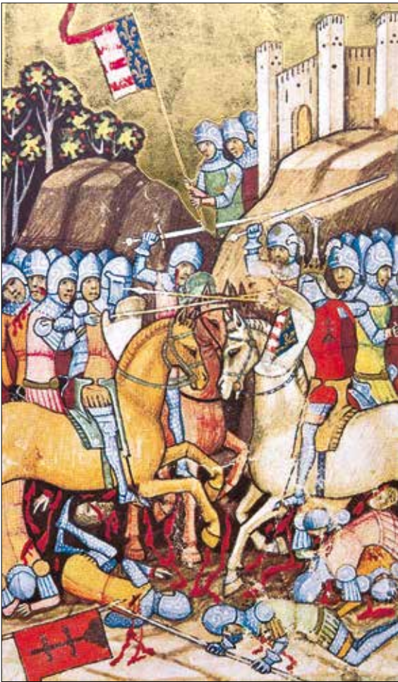
Obrázok 6: Bitka pri Rozhanovciach

Ten s veľkou pravdepodobnosťou postupoval južným smerom. V opačnom prípade by sa kráľ nemohol stiahnuť na Spiš, pretože by tak vojská na seba narazili. Omodejovci sa mohli presunúť ku Košiciam, ktoré im boli stále trňom v oku. Kvôli mestu sa proti nim obrátil kráľ a hrozil reálny úpadok ich moci. Na prelome mája a júna obľahli mesto na obdobie dvoch týždňov. K mestu postupne prišli aj pomocné vojská Matúša Čáka a zvolenského župana Demetera. Obliehanie vyzeralo sľubne až do 14. júna 1312. Vtedy k mestu prišiel Karol I. so svojim vojskom, ktoré posilnili spišskí Sasi.