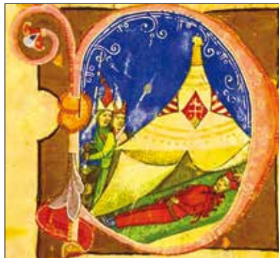
Obrázok 3: Smrť Ladislava IV. Kumánskeho