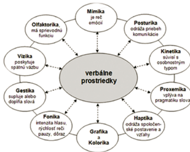
Obrázok 2: Funkcie neverbálnych prostriedkov v komunikácii 4)

Problematike neverbálnej komunikácie, resp. reči tela, sa v súčasnosti venujú desiatky titulov. Na obrázku 2 je znázornené rozdelenie neverbálnej komunikácie na konkrétne skupiny podľa autorky Jany Klincovej.