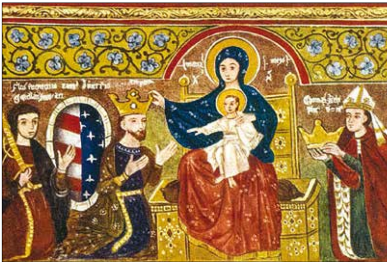
Obrázok 4: Korunovácia Karola I.

sa začal zaoberať aj pápež, ktorý podporoval dedičné právo Karola. Spor sa vyvinul až natolko, že pápež si predvolal oboch kandidátov pred svoj súd. Na ňom rozhodol, že uhorskú korunu má získať Karol a Václav na trón nemá žiadny nárok. Ani tento rozsudok však nepomohol a obidvaja sa naďalej snažili získať vládu v Uhorsku. Až v roku 1304 sa kráľ Václav stiahol z Uhorska späť do Česka, pričom vzal so sebou aj svätoštefanskú korunu. Určite chcel iba preskupiť sily a znova sa zapojiť do bojov o trón. V roku 1305 však zomrel Václav II. a mladý Václav III. sa stal českým kráľom. Musel sa sústrediť na konsolidáciu moci v domácom prostredí. Svätoštefanskú korunu a právo na vládu v Uhorsku odovzdal bavorskému kniežaťu Otovi III. Wittelsbachovi. Oto mal tiež arpádovských predkov a takisto bol akceptovateľný ako uhorský panovník. Václavova vláda v Česku nemala dlhé trvanie. V roku 1306 bol zavraždený a České kráľovstvo sa dostalo do podobnej situácie medzivládia ako Uhorsko.