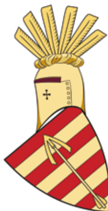
Obrázok 7: Erb magistra Donča

Kráľovým najväznejším protivníkom bol aj po bitke pri Rozhanovciach Matúš Čák Trenčiansky. Stále bol priveľmi mocný a po prehratej bitke o poznanie agresívnejší. Karol I. sa proti nemu snažil zakročiť, ale na to nemal dostatok sily. Trenčiansky oligarcha ešte aj v tomto čase ovládal takmer 60 hradných panstiev a vyše 500 dedín. Išlo o najrozsiahlejšiu súvislú dŕžavu, navyše veľmi dobre chránenú zo všetkých strán vďaka rozvetvenej hradnej sústave. Kráľ sa preto rozhodol vysporiadať sa najprv s ostatnými barónmi krajiny. V prvom rade odvolal všetkých dovtedajších kráľovských úradníkov 4) a nahradil ich svojimi vlastnými podporovateľmi. Potom sa musel vysporiadať s nespokojnými veľmožmi, ktorým tak odstaviť dôležitú časť príjmu a výsadné práva. Sústredil sa najmä na centrálnu Uhorsko. Ako s prvými sa poráтал s Boršovcami, od ktorých dobyl viacero hradov. Následne sa presunul do Sedmohradska, kde bojoval proti synom sedmohradského vojvodu Ladislava Kána. Tí po otcovej smrti sedmohradské vojvodstvo nezískali a povstali proti kráľovi. Karol I. však ich vojsko porazil a upevnil tak svoju moc aj v tejto časti kráľovstva. Vďaka panovaniu Ladislava Kána ako vojvodu sa Sedmohradsko v nasledujúcom období stalo oveľa nezávislejšou správnu časťou krajiny.