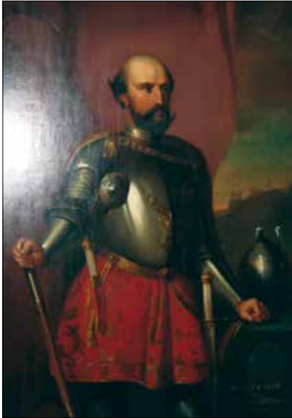
Obrázok 1: Historizujúci obraz Matúša Čáka