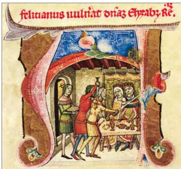
Obrázok 8: Atentát Feliciána Zacha na kráľa Karola I.

Matúšova moc sa po prehratej bitke pri Rozhanovciach zmenšovala len veľmi pomaly. Vedel, že sa môže stále spoľahnúť na svojich najvernejších familiárov. Odmeňoval ich významnými funkciami na svojom dvore alebo ich poveroval správou svojich majetkov. Vzhľadom na to, že Matúšovo panstvo bolo jedno z najrozsiahlejších, mal aj väčšie množstvo familiárov. Podľa všetkého mu dobrovoľne slúžilo okolo tridsať stredných a nižších šľachticov, často celé šľachtické rody.