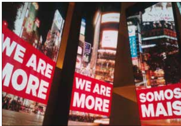
Obrázok 6: Sme viac ako len konzum

Doba sa zmenila a človek už nežije na rovnakej pozícii ako v minulosti, keď mu na prežitie stačilo málo. V západnom svete si berie príklady a chce dosiahnuť stále viac. Dokonca tak veľa, že toľko ani nepotrebuje.