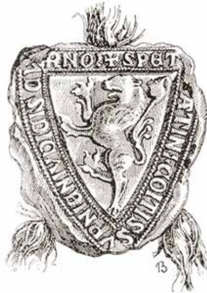
Obrázok 2: Erb Petra Čáka

Matúš Čák pochádzal z trenčianskej vetvy Čákovcov. Jej zakladateľom bol jeho starý otec, Matúš I. Po bitke pri rieke Slaná, v ktorej bojoval proti mongolskému vojsku, mu boli udelené prvé majetky v Ponitří. Okrem toho zastával úrad kráľovského stolníka (zodpovednosť za hospodárstvo dvora aj kráľovstva), taverníka (správcu pokladnice), nitrianskeho a bratislavského župana. Išlo o významné krajiniské hodnosti, ktoré so sebou prinášali veľkú moc. Jeho synovia sa tiež angažovali na kráľovskom dvore. Za krátkej vlády kráľa Štefana V. (1270 – 1272) získali prvé funkcie, ktoré si neskôr ponechali aj za vlády jeho syna Ladislava IV. Kumánskeho (1272 – 1290). Ladislav IV. bol na začiatku svojej vlády ešte len dieťa. Namiesto neho vládla jeho matka a zbor radcov, medzi ktorých patrili aj Čákovci. Z tohto dôvodu prebiehali na kráľovskom dvore boje o moc. S Čákovcami súperili rody Kyseckých a Gutkeledovcov. Vyskytovali sa aj časté ozbrojené potýčky. Čákovci si však dokázali udržať najväčšiu moc, čo dokazuje aj množstvo úradov, ktoré zastávali. Spomedzi nich bol najdôležitejší titul palatína, teda správcu kráľovstva. Išlo o najmocnejšieho muža v kráľovstve, okrem samotného kráľa. Petrovi Čákovi sa podarilo získať úrad palatína v polovici sedemdesiatych rokov 13. storočia. Okrem toho zastával aj úrad sedmohradského vojvodu. Držiteľ týchto najdôležitejších funkcií v kráľovstve bol automaticky považovaný za baróna, teda jedného z najvyššie postavených šľachticov kráľovstva.