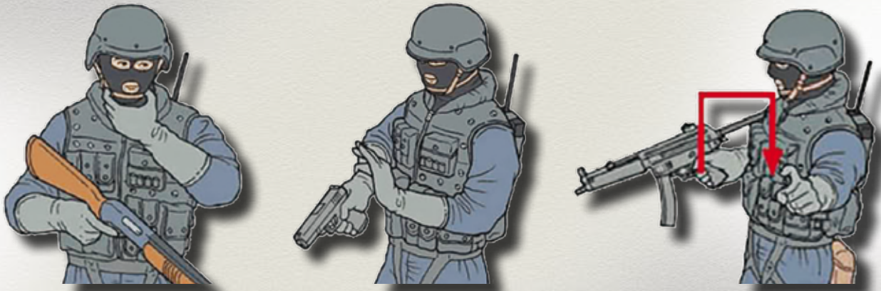
Neverbálna komunikácia bezpečnostných zložiek

Neverbálna komunikácia zahŕňa všetky prejavy komunikácie, ktoré nie sú vyjadrené slovami. Prebieha na báze emócií a myšlienok. Zahŕňa postoj, chôdzu, gestá, dotyky, mimiku alebo držanie tela. Zdôrazňuje verbálne prejavy komunikácie. Tvorí väčšiu časť informácií, ktoré sa o človeku dajú zistiť počas rozhovoru. Špecifická forma neverbálnej komunikácie existuje aj v bezpečnostných zložkách. Služi na dorozumievanie sa v situáciách, kedy nie je možné využiť verbálnu, rádiovú alebo elektronickú komunikáciu.